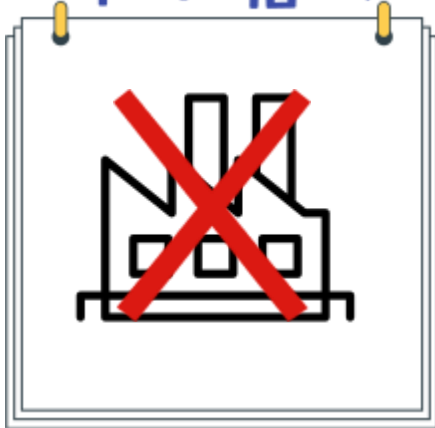
허가받지 않은 시설에서 제조한 식품