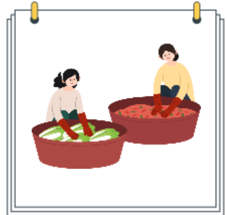
지인이 제조한 식품