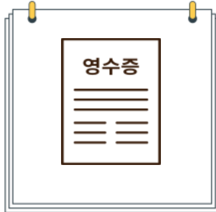
영수증 발급이 불가능한 곳의 식품