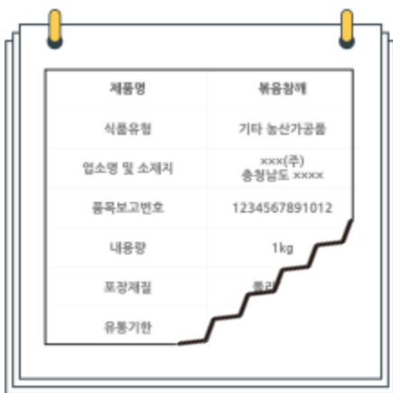
유통기한이 찢어진 식품